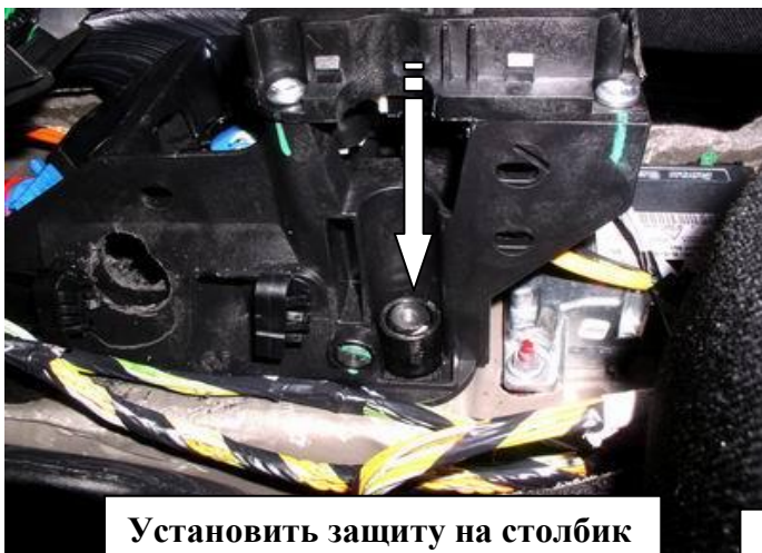
Установить защиту на столбик