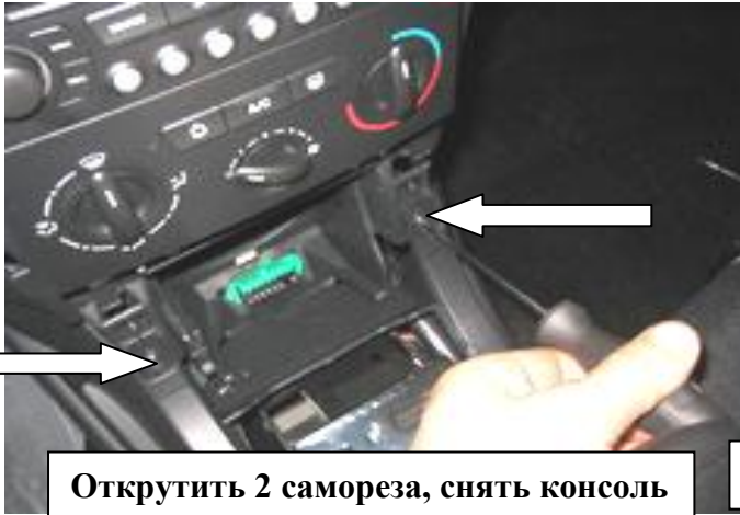
Открутить 2 самореза, снять консоль