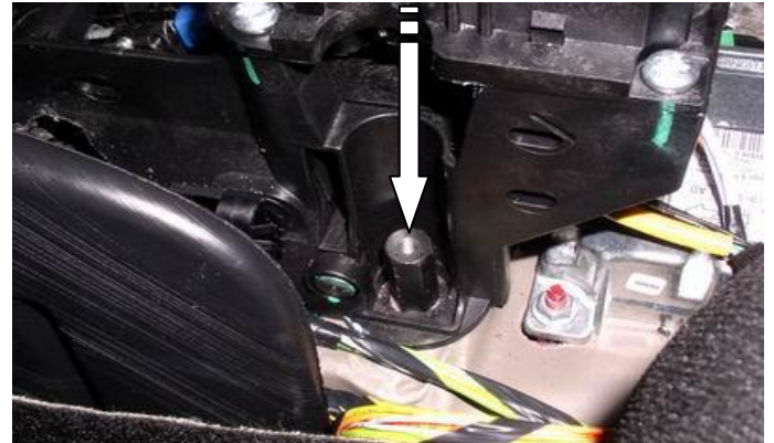
Открутить гайку, установить на шпильку столбик