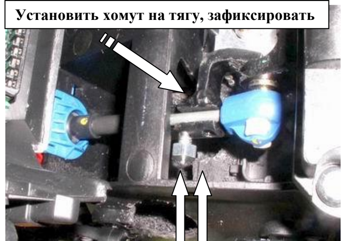
Установить хомут на тягу, зафиксировать