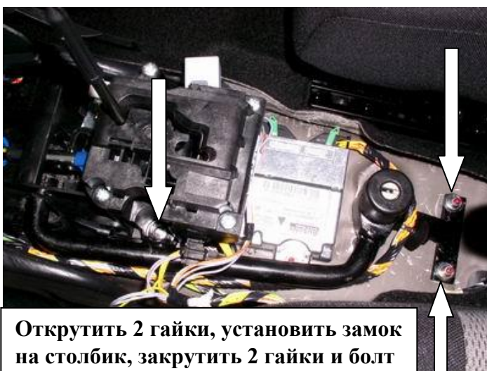
Открутить 2 гайки, установить замок на столбик, закрутить 2 гайки и болт