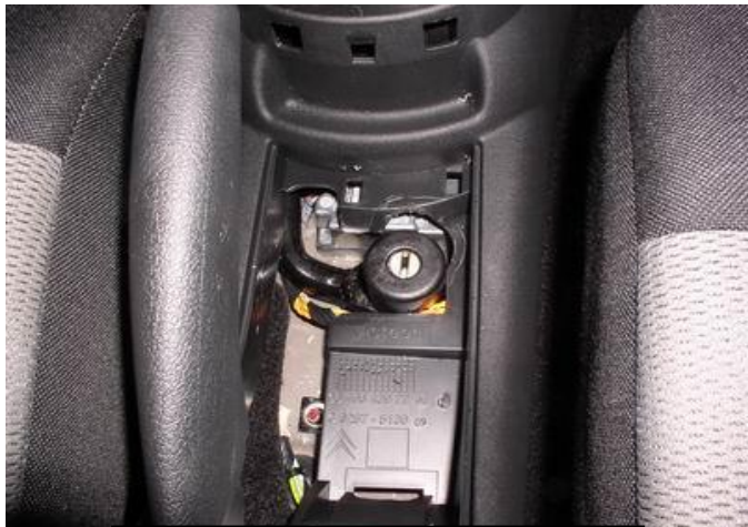
Установить консоль на место