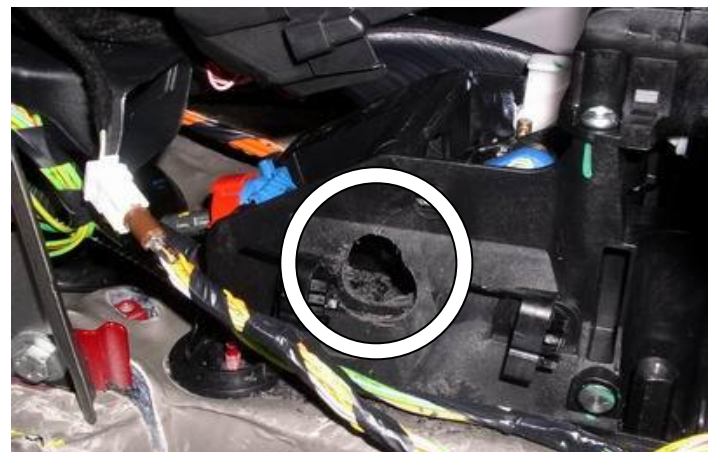
Просверлить отверстие в селекторе под трубу замка