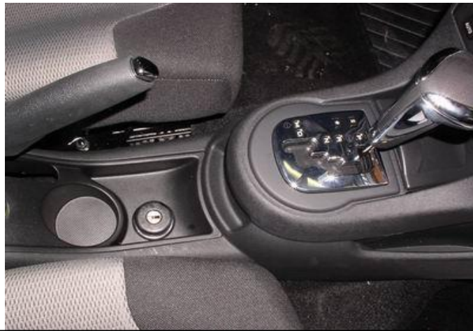
Разметить, используя разметочный шаблон, и просверлить отверстие в крышке под корпус замка, установить крышку на место